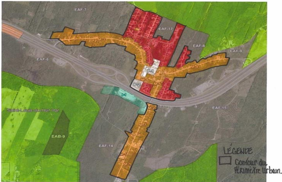
Plan de zonage de Saint-Louis-du-Ha! -Ha!

Tout ce qui est de couleur orange et rouge représente le périmètre d'urbanisation. Le secteur de couleur turquoise représente la zone industrielle I-1.