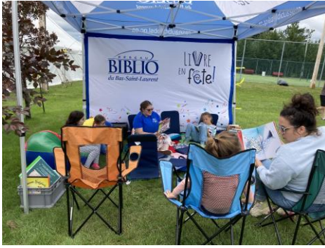
Livre en fête